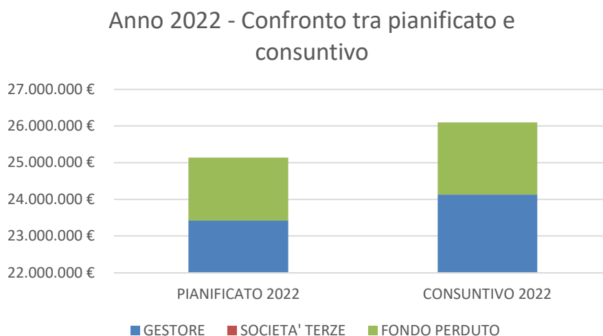
Fig.1 – Istogramma di confronto tra quanto pianificato e quanto rendicontato nel 2022

Dalla tabella sopra riportata si nota come il gestore HERA abbia effettuato nel corso del 2022 investimenti superiori rispetto al pianificato per circa il 4%.