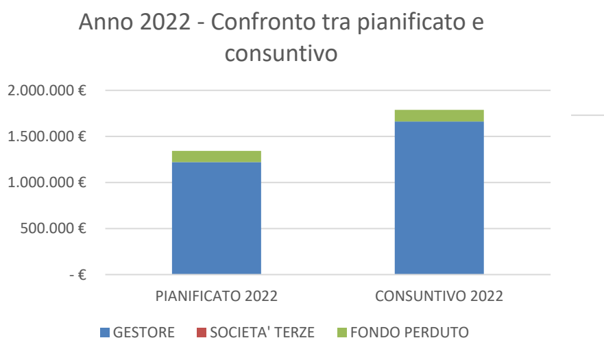
Fig. 1 – Istogramma di confronto tra quanto pianificato e quanto rendicontato nel 2022

Dalla tabella sopra riportata si nota come il gestore HERA abbia effettuato nel corso del 2022 investimenti superiore rispetto al pianificato per circa il 33%.