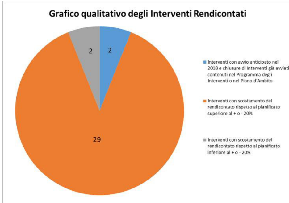
Fig.2 – Illustrazione qualitativa degli interventi avviati dal gestore e rendicontati

(€ 749.152), a dimostrazione comunque che, sebbene lo scostamento complessivo (€ 84.464 – cfr. Tab. 1) sia esiguo, la programmazione approvata non è stata seguita fedelmente dal gestore dal punto di vista degli importi.