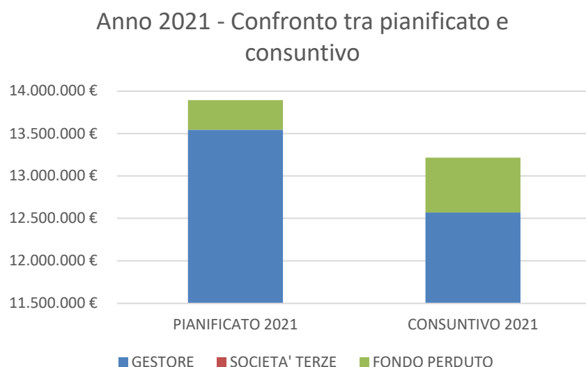
Fig.1 – Istogramma di confronto tra quanto pianificato e quanto rendicontato nel 2021

Dalla tabella sopra riportata si nota come il gestore AIMAG abbia effettuato nel corso del 2021 investimenti inferiori rispetto al pianificato per circa il 5%.